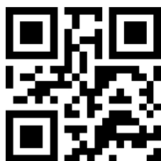
Costa meridionale VYGWNEPH